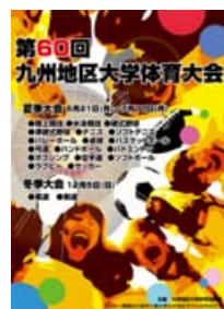
第60回九州地区大学 体育大会ポスター

このポスターは、団結力とチームワークをテーマに作りました。前回までのポスターの雰囲気の中にどうやって新しさを表現するかが課題でした。先生や友達に相談しながら完成したポスターなので採用されてとてもうれしいです。ありがとうございました。