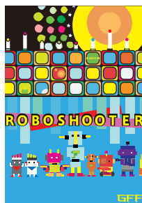
第3回 福岡ゲームコンテスト ゲームパッケージ部門

情報ネットワーク工学科の学生が2次元コンピュータグラフィックスの授業で学んだ技術と大学生活で得た知識・感性をもとに制作した作品が、各種デザインコンテストにおいて、見事、入賞やグランプリを受賞するなど、大活躍しています。